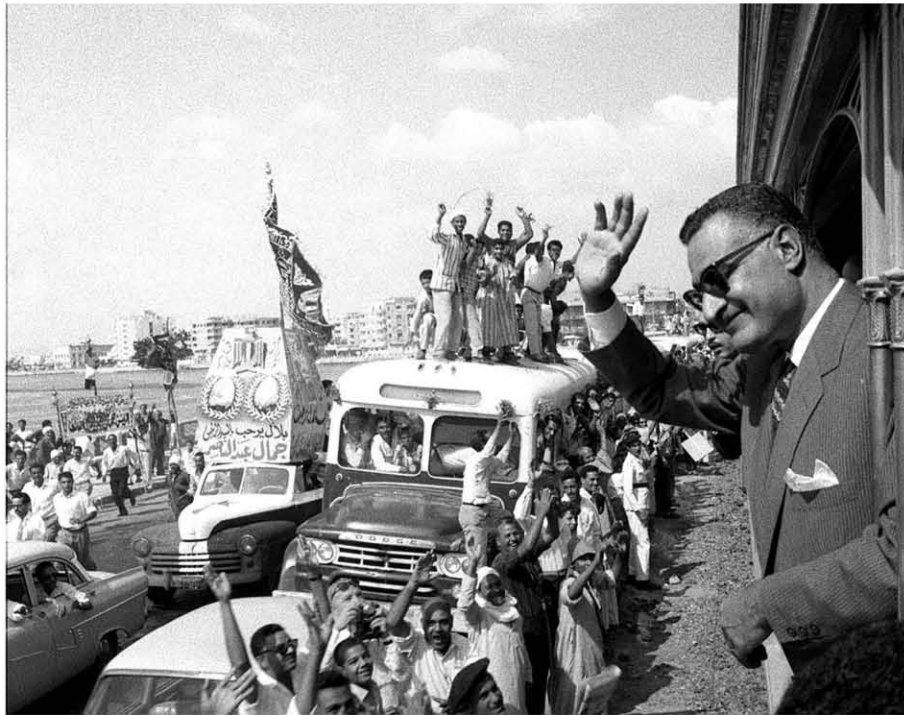
الرئيس جمال عبد الناصر في طريقه لاستقبال القوات المصرية العائدة من اليمن في السويس